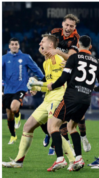
Successo La gioia del Como