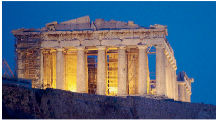
Atena e Zeus Il Partenone di Atene